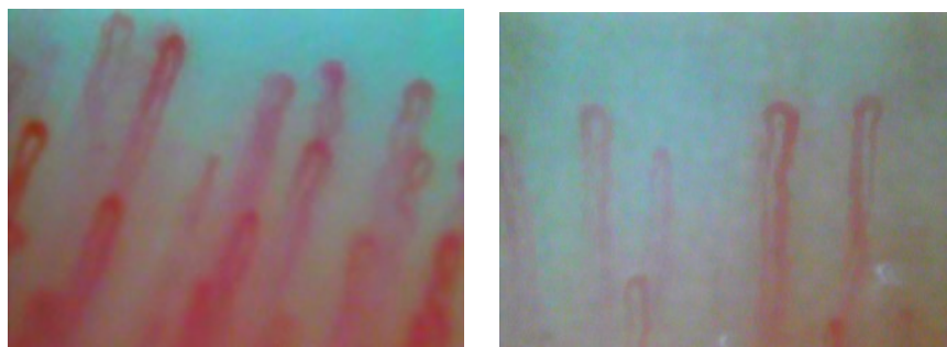
図 1. 爪床毛細血管スコープ写真

かなど、より詳細な検討も行う予定です。毛細血管スコープによる NC 測定は非侵襲的で誰でも測定できるため、検診や日常生活などで活用され、患者の意識変革と行動変容を促すような簡便なツールになることが期待されます。